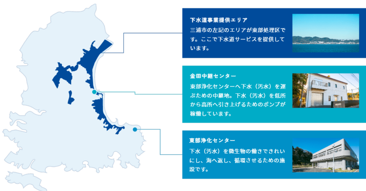
図 1-1.三浦市公共下水道（東部処理区）事業エリア